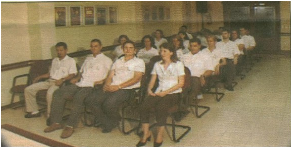
Auditório da De Paula